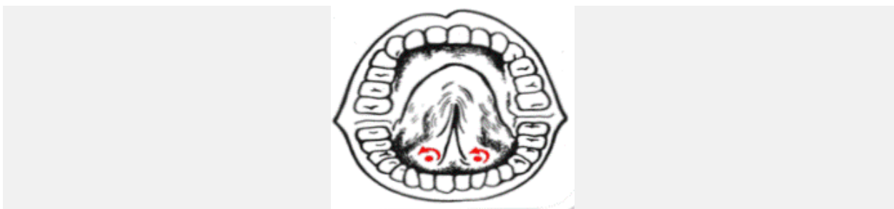
массаж при гиперсаливации

Проводится точечный массаж в углублениях под языком, в двух точках одновременно (см. рисунок). Массаж осуществляется при помощи указательного, среднего пальца или зонда. Вращательные движения выполняются против часовой стрелки, не более 6-10 секунд. Движения не должны причинять ребёнку дискомфорт.