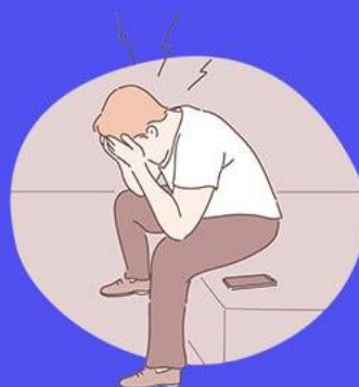
Стресс, тревога, депрессия