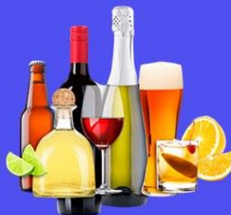
Избыточное потребление алкоголя