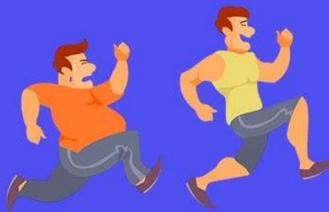
Низкая физическая активность